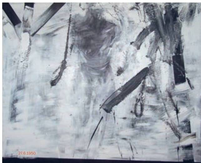
Den dvacátý sedmý 2010 akryl 180 x 230 cm