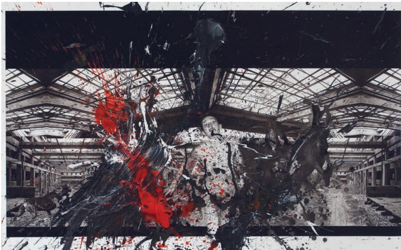
Mater Mortis 2009 fotokoláž tuše akryl 80 x 130 cm

a čtení dopisů Státní bezpečnosti máme hromadné sledování mluvených a psaných komunikací automatizovanými sběrnými systémy, jejichž úspěšnost je do značné míry umožňována zaslepeně z povědním chováním uživatelů sociálních médií; místo cynicky ohebných (a kontradikcí znemožňujících) „pravd“, kterými normalizační režim skládal svůj vykonstruovaný svět, máme snadno doladovatelná „fakta“ Wikipedie a digitálně upravovatelné „skutečnosti“ zpravodajských agentur; místo jazykově primitivní a myšlenkově deformované stranické rétoriky máme elektronické nástroje, které upravují, dokonce dopisují naše věty, máme emaily a SMSky svádějící ke zkratkovitému vyjadřování a povrchním myšlenkovým pochodům. Někdejší cenzura nutící autory textů k promítání nepohodlných obsahů kódovaně „mezi řádky“ se nahradila — podle jejich odpůrců — další omezující šablonou zvanou politická korektnost plodící umělé, mnohdy úsměvně eufemistické obraty. Zato „obyčejní“ lidé dále žijí svými sny o výhře v loterii, svými estrádními zábavami a mýdlovými operkami. Ve světě zprostředkované elektronické komunikace je jazyk stále zjednodušovaný, a proto přestává být nosným základem náročnějšího myšlení. Čím více dnešní člověk spoléhá na mezilidské spojení „na dálku“, tím méně je schopný udržovat emocionální komplexitu vztahů v reálném osobním měřítku.