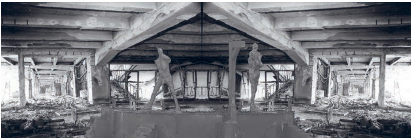
Popraviště 2014 fotokoláž 50 x 130 cm

Systematické zasahování do soukromí občanů, snaha stavět děti proti rodičům, lež vydávaná za pravdu, manipulace s psychikou občanů, to vše, co Orwell popisoval a bylo vydáváno za fikci, bylo opakovaně od roku 1948 naplněno v praxi.