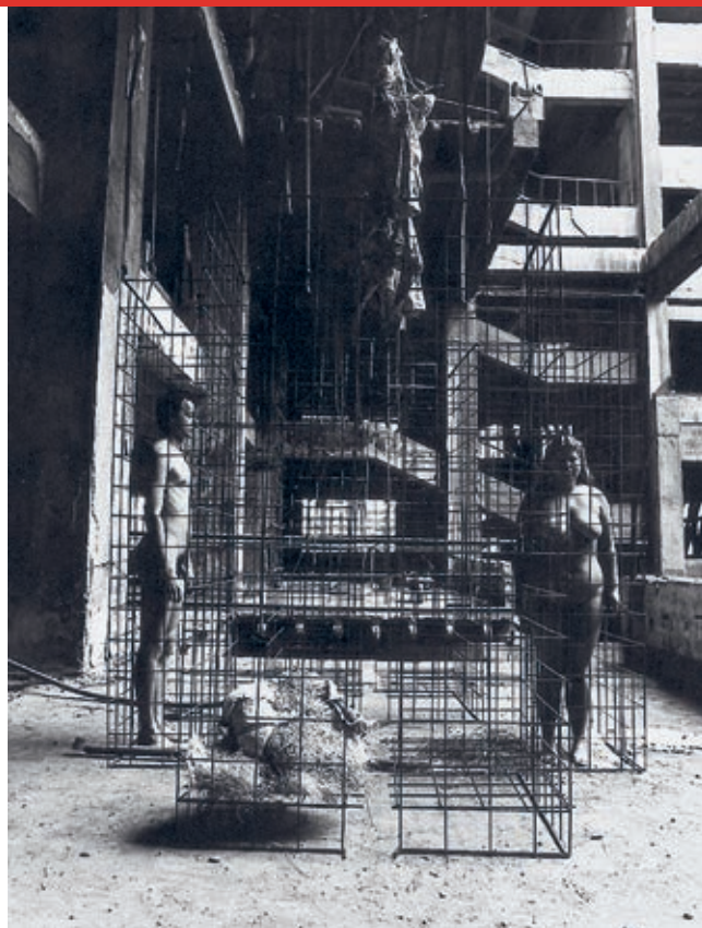
Fotodokumentace z akcí 1984 foto: Jaroslav Kučera, Jiří Putta 40 x 30 cm

Celá instalace, která je zároveň připomínkou 25. výročí sametové revoluce, představuje velkoformátové malby, plastiky, videa, interpretované fotografie a fotokoláže. Tato výstava, tedy interpretace Veletržního paláce (či jeho torza) představuje jakési výtvarné završení celého projektu věnovaného 40. výročí požáru Veletržního paláce.