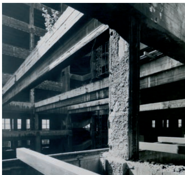
Skelet Veletřního paláce po požáru dokumentární fotografie