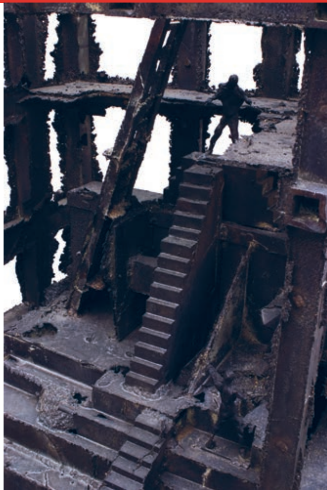
Skelet 2008 bronz, detail

http://www.ngprague.cz/cz/1085/sekce/studijni-materialy/