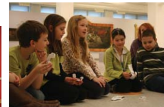
V těle krajiny (program pro I. stupeň ZŠ)

pozn.: doporučeno pro žáky 1.—4. ročníku ZŠ