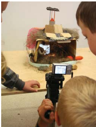
Tajemství lesa (program pro I. stupeň ZŠ)