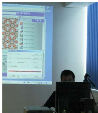
Umění (v) pohybu (program pro II. stupeň ZŠ)

pozn.: program z kapacitních důvodů určen skupinám o počtu max. 23 žáků