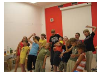
Pohyblivé obrazy (program pro I. a II. stupeň ZŠ)

pozn.: doporučeno pro žáky 3.—6. ročníku ZŠ, max. 20 žáků ve skupině