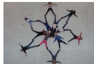
2D aneb v rytmu tvarů (program pro II. stupeň ZŠ)