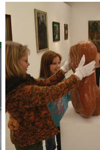
Dotkni se (program pro I. stupeň ZŠ)

autoři děl: H. Moore, E. Grate, F. Wotruba