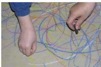
Příběh čáry (program pro I. stupeň ZŠ)

pozn.: program je vhodný pro žáky 1.—3. třídy ZŠ