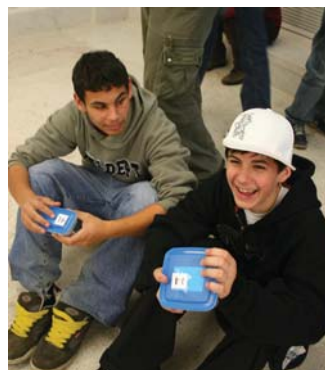
Chvilka bez omezení (program pro II. stupeň ZŠ)

pozn.: doporučeno pro žáky 7.—9. ročníku ZŠ