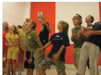
Pohyblivé obrazy (program pro I. a II. stupeň ZŠ)

pozn.: doporučeno pro žáky 3.—6. ročníku ZŠ, max. 20 žáků ve skupině