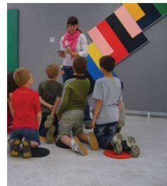
Světlem tvarů (program pro I. stupeň ZŠ)

pozn.: doporučeno pro žáky 1.—3. třídy ZŠ