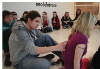
Tělo jako médium (program pro SŠ)