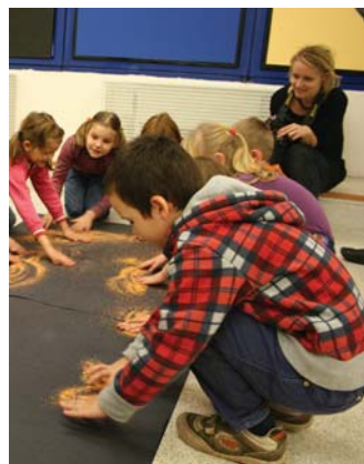
V dálce svítí (program pro MŠ)