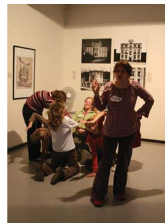
Kubistické proměny (program pro II. stupeň ZŠ)