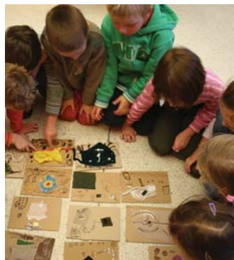
Co jsem našel, to jsem schoval (program pro MŠ)