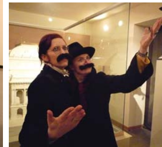
Proč hořelo Národní divadlo? (program pro II. stupeň ZŠ a SŠ)

pozn.: doporučeno pro skupinu max. 20 žáků 8. a 9. ročníku ZŠ