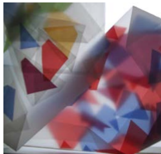
Co se skrývá v kameni (program pro I. stupeň ZŠ)