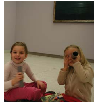
Skrýté skrýše (program pro MŠ)