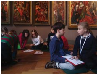
Velikonoce, to není jen pomlázka — o původu a symboech Velikonoc (program pro ZŠ)

autoři děl: Andrea della Robbia, J. Gossaert zv. Mabuse, J. Ribera, Luca Giordano. P. P. Rubens