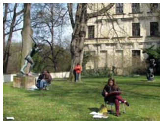
Zátiší, krajinomalba, žánrový obraz (program pro SŠ)