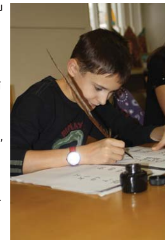
Skriptorium — dílna středověkého pisaře (program pro ZŠ)