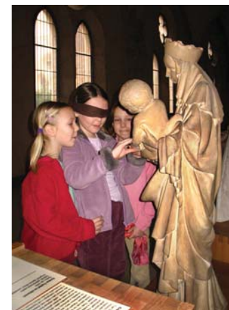
Se zavřenýma očima (program pro ZŠ)

pozn.: doporučeno pro žáky 6.–9. ročníku ZŠ