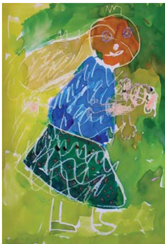
O mamince (program pro MŠ a 1.–2. ročník ZŠ)

Na uvedené programy, které probíhají v expozici před originály uměleckých děl, navazuje tvůrčí činnost v dětském ateliéru, při které mohou děti své zážitky vyjádřit formou výtvarné hry. Mnoho programů je navíc doplněno dalšími aktivitami (hry, skládačky, zábavné kvízy apod.). Programy a jejich náročnost jsou přizpůsobeny stáří dětí, věkové doporučení pro určité třídy není závazné. Pro práci v ateliéru dětem doporučujeme přinést si vlastní pracovní oděv.