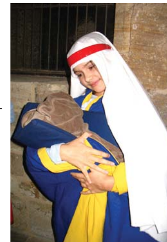
V dílně středověkého řezbáře (program pro ZŠ)

pozn.: doporučeno pro žáky 2.–5. ročníku ZŠ