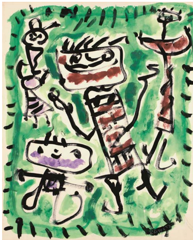
Jan Křížek, Bez názvu (Čtyři figury) , 1957 kvaš, papír, 562 x 451 mm

Tyto a další Studijní materiály jsou k dispozici ke sta- žení zdarma na http://www.ngprague.cz/cz/1085/ sekce/studijni-materialy/