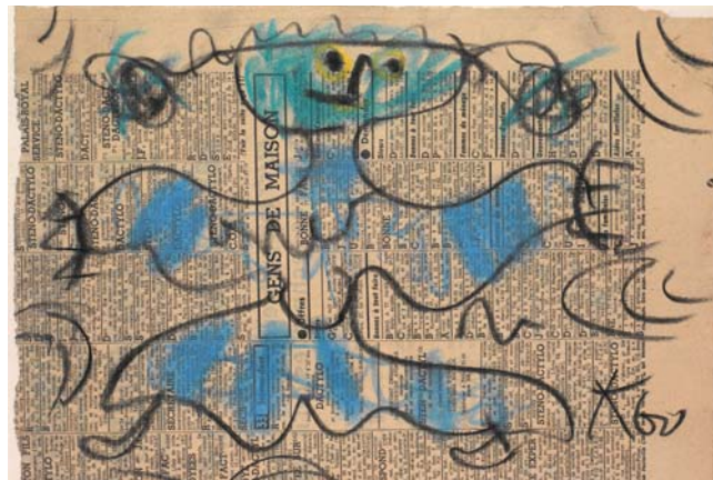
Pohled Jan Křížek, Bez názvu , 1960 uhel, pastel, novinový papír, 245 x 320 mm

Hotové kresby si můžete vzít s sebou anebo připíchnout na stěnu, aby si je mohli prohlédnout ostatní návštěvníci.