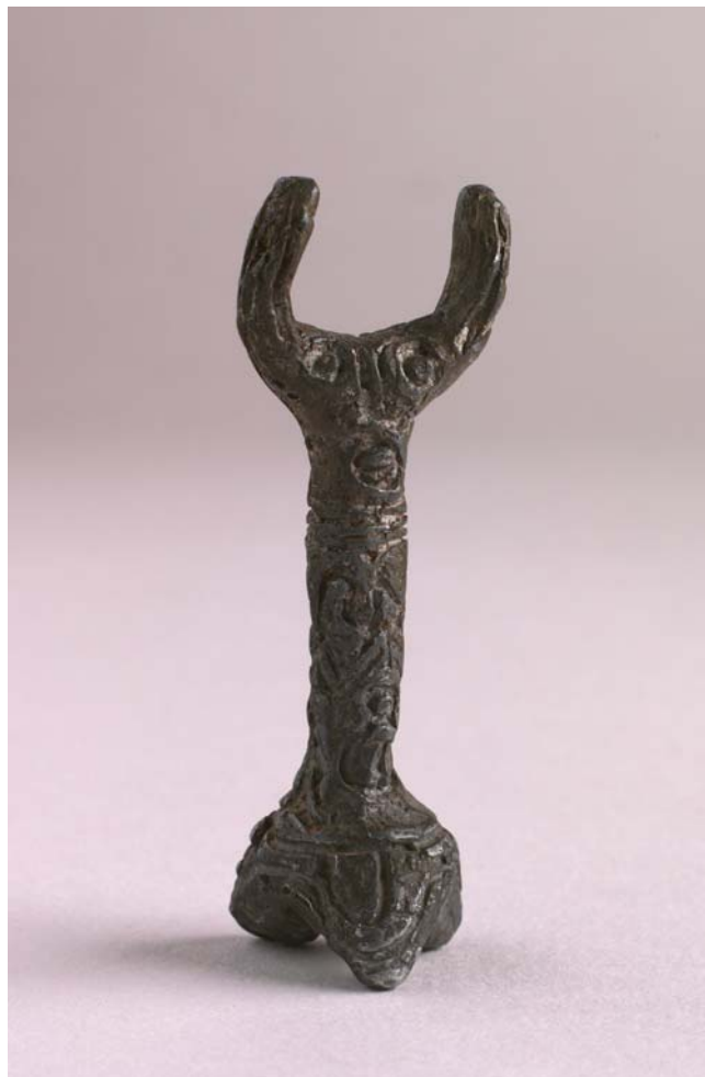
Jan Křížek, Bez názvu (Postava s rohy) , 50.–60. léta olovo, 8 x 1,5 x 1,5 cm

Sledujte se svými žáky, co dílo Jana Křížka s tvůrci art brut spojuje, a co je naopak odděluje. Hledejte spojnice mezi Křížkovou tvorbou, archaickým a primitivním uměním. (Stručnou definici najdete v slovníčku pojmů.)