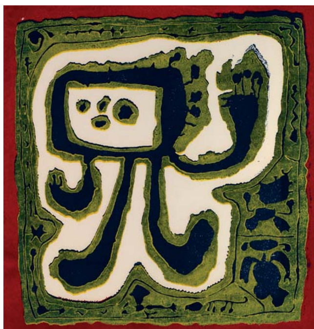
Jan Křížek, Bez názvu – Figura , 1959 linoryt, papír, 325 x 251 mm

(v odpovědi na otázku Michela Tapiéa: Michel Tapié, Sculptures de Krizek , éditions René Drouin, Paris 1948)