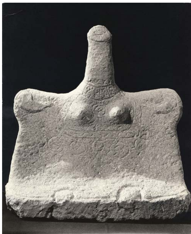
Jan Křížek, Bez názvu (Ženská figura) , 1955 žula, 61 x 53 x 19 cm