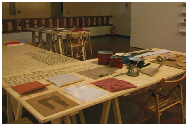
Pohled do studia

Obyčejnost prostředků bývá typická i pro jiné projevy syrového umění často také z důvodu materiální nouze jeho tvůrců.