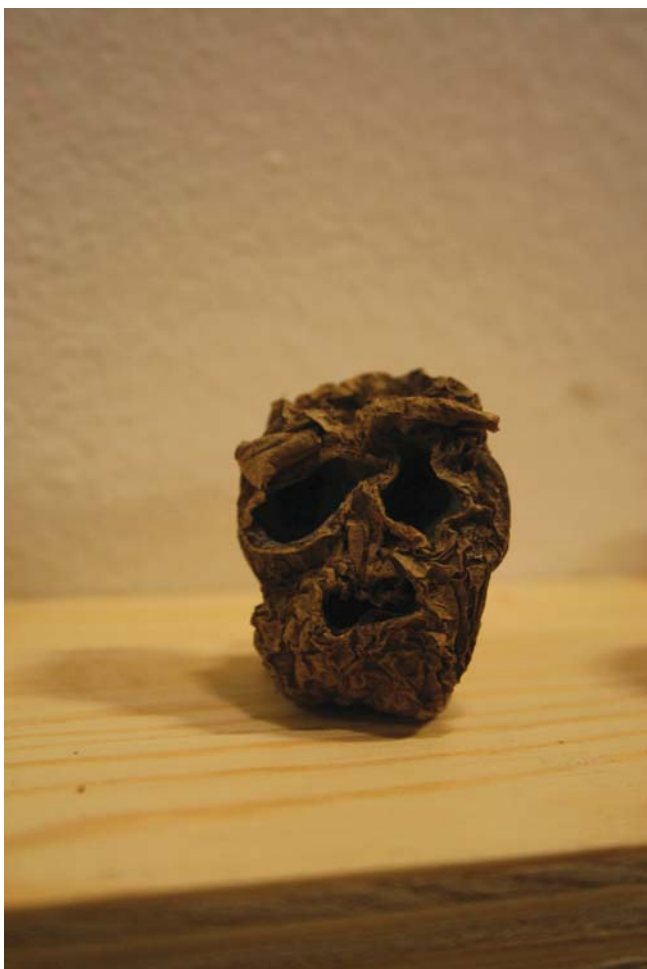
Dílo návštěvníka výstavy „bramborová socha“