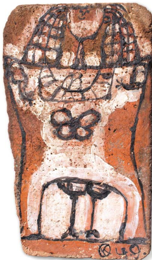
Jan Křížek, keramický kachel, 1949 pálená hlína, glazura, 28,4 x 16,8 x 2 cm