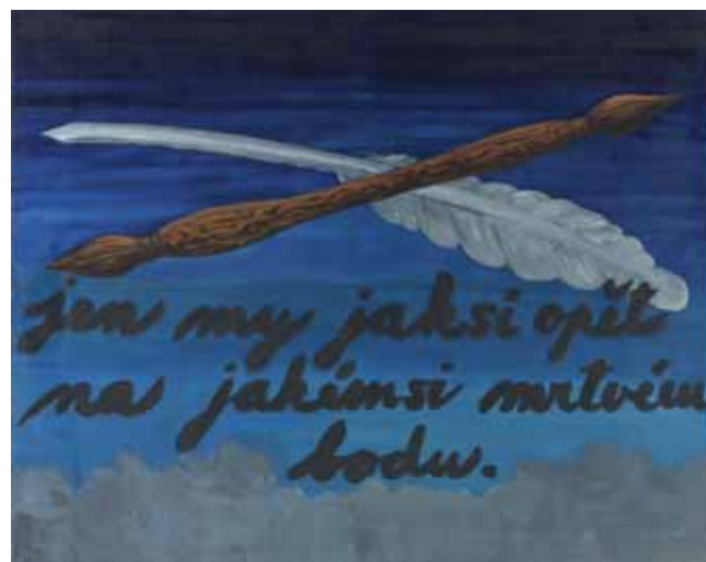
Tomáš Císařovský, Štětcem a perem , 1988 akryl, plátno, Národní galerie v Praze

http://www.ngprague.cz/cz/1085/sekce/studijni-materialy/