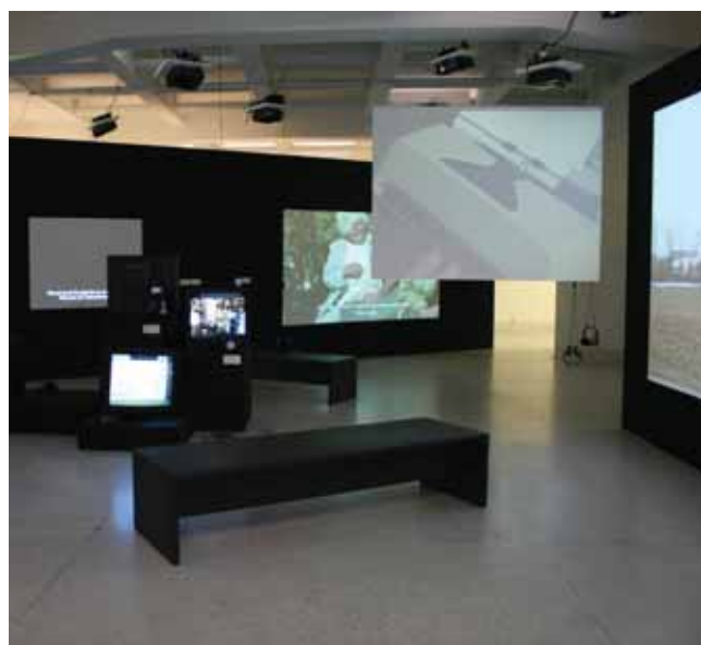
Výstava OSTROVNY ODPORU. Mezi první a druhou moderností 1985–2012 pohled do expozice

Způsob instalace Ostrovny odporu ve Veletržním paláci probouzí četné asociace. Prostřednictvím některých částí výstavního prostoru můžeme nahlédnout zpět v čas, do poloviny 80. let minulého století, kdy jako zjevení zapůsobily na tehdejší návštěvníky improvizované výstavy v kulturních střediscích na Opatově, v Blatinách či v Makromolekulárním ústavu ČSAV v Praze na Petřinách. Mimo oficiální galerie a zavedené výstavní prostory se tehdy poprvé veřejně prezentovali mladí tvůrci, kteří s sebou přinášeli hravost, novou formu kresby a malby, narážky na tabuizované kapitoly historie i skrytou polemiku s estetickým kánónem tehdy již zcela konvencionalizované avantgardy a abstraktního umění. Na přelomu 80. a 90. let se pak tato generace, jejíž díla kolem roku 1985 předjímalá opojnou atmosféru změny, vydala na pout' po významných evropských galeriích, aby se stala součástí velké konfrontace umění posledních desetiletí, vznikajícího na obou stranách někdejší železné opony.